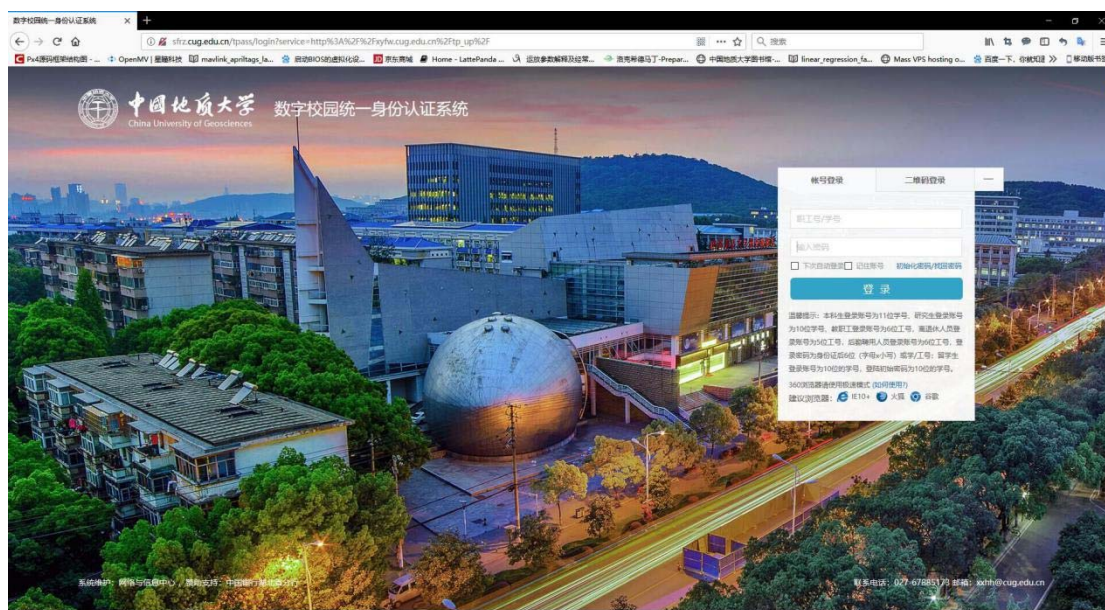
中国地质大学校园统一身份认证界面